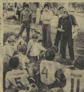
г. Орджоникидзе.